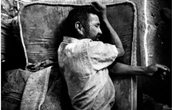
© Toni Arnau, Pau Coll i Edu Ponces